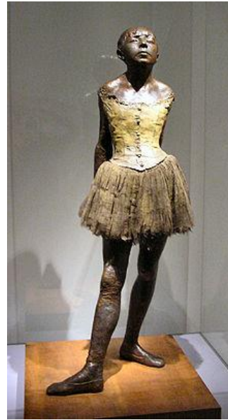
Resim 12, Edgar Degas, “Little Dancer”

Hirst’ün ‘Virgin Mather’i için kullandığı model, Degas’ın heykelinden ilhamla yapılan bu yüz ve beden duruşudur.