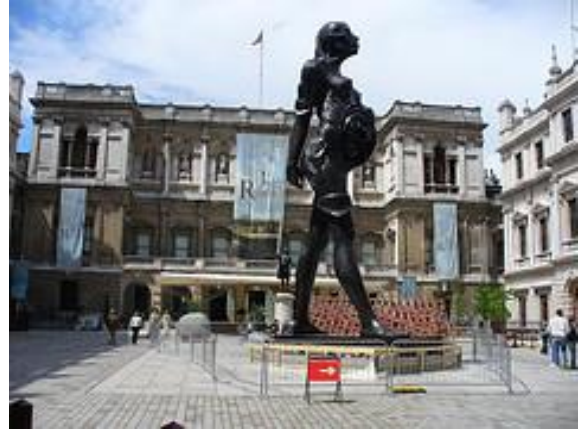
Resim 11, Hirst Damien, “Virgin Mather” Royal Academy of Arts

Hirst’ün ‘Virgin Mather’i için kullandığı model, Degas’ın heykelinden ilhamla yapılan bu yüz ve beden duruşudur.