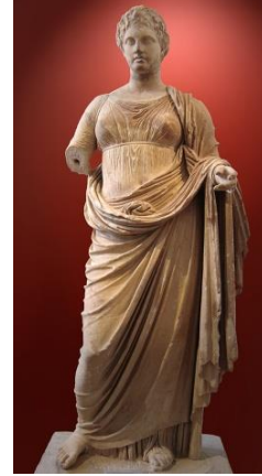
Resim 2, Themis-Atina

Roma mitolojisinde 'Justitia (Iustitia) adaletin simgesi olur. Justitia Themis'e değil de daha çok Dikeye benzer, der Azra Erhat. Farkı, gözlerinin kapalı olarak simgelenmesidir. Romalılar, tanrıçanın, adaletli bir yargılama yapabilmesi için, gözlerinin kapalı olması ve karşısındakini görüp etkilenmemesi gerektiğini düşünmüşlerdir. Hukuk ve adalet ile birlikte anılan Jusitita, daha çok ahlaki değerlerle güçlendirilmiş bir adalet anlayışını betimlemektedir.