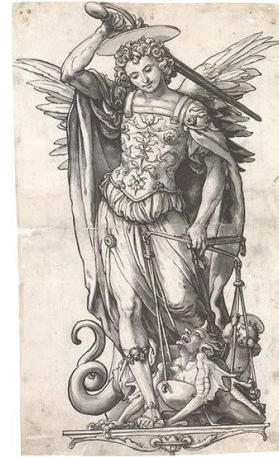
Resim 7, Hans Holbein, "Baş melek Michael ruhları tartıyor" 1523

Orta Çağlarda, inanç konusu olan, vahiy yoluyla kutsal kitaplarda bildirilmiş olan 'Tanrı' anlayışının yanı sıra bir de giderek düşünce konusu olan 'tanrı' anlayışı vardı ki bu ikincisi Rönesans'ı doğuracaktır. Sanatçı kilise otoritesinden bağımsızlaşacak, ressamlar ve sanatçılar birey olarak öne çıkmaya başlayacaktır. Bütün bu çağlar boyunca karanlıkta kalan Antik Yunan düşüncesine ve sanatına yeniden dönülecektir.