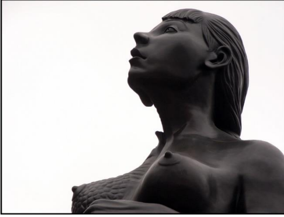
Resim 13, Hirst, "Virgin Mather" detay

Tanrıça imgesi, Jung tarafından geliştirilen psikolojik düşünce külliyyatında " arketip; bir ön varoluş biçimi" olarak kabul edilir. "Arketiplerin yitimi kültürleri içeriksiz bırakır, kolektif babaerkil ilkeyi dengeleyecek yaşamsal kadınsılığın yokluğu halinde, yaşamda belirgin bir kısırlık vardır. Yaratıcılığın ve kişisel gelişimin soluğu tıkanır" der "Kutsal Fahişe" kitabında Qualss-Corbett ve devam eder; "Cinsellik, doğurma ve kutsallığı birlikte barındıran tanrıça imgesi, giderek yerini Âdemin cennetten kovulmasına neden olan Havva'ya bıraktı... Tanrı adına cinsellik ve bedeni hazlar sökülüp atıldı... Kadınlar babalarının ve sık sık satıldıktan sonra da kocalarının mülkü olarak görülüyordu... Tanrıçanın olumlu özellikleri bir dereceye kadar, Katolik inancında bakire Meryem figürü ile bütünleşmiştir fakat Protestan ülkelerin hemen hiç birine bu bütünleşme de sızmadı ve Meryem bir Noel dekoru olarak, sevecen anne figürü olmak dışında, dünsel yaşamdan sürülüp atıldı" (Qualss-Corbett , 2001:20,59-65)