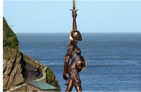
Resim 1, Damian Hirst, “Verity”, 2012

Hirst’ün Verity’si pek çok şekilde okunabilir, fakat Hukuk ve Sanat arasında ilişki kurmak amacıyla, Sanat ve Hukukun “Adalet kavramı” altında, henüz daha ayrımlarının netleşmediği, iç içe geçtikleri mitsel arka tasarımdan başlamak, ortak terimleri saptamak ve bu terimlerin simgelerin ardına gizlenerek görünüşe çıkmalarını izlemek, Verity’i bu bağlamda okumak için bir yol haritası çizmekte.