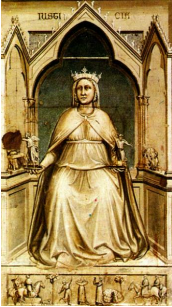
Resim 8, Giotto, giustizia 1306, Padova

Bu küfelerden birinde fazileti, diğerinde elinde kılıç ile ahlaksızlığı cezalandıran iki figür vardır. Fazilet yine dişil olarak resmedilmiştir ve onun da başında taç vardır. Çünkü Adalet gibi o da hüküm sahibidir. Kılıç tutan figür ise erildir. Tahtın altında ise günlük yaşamdan sahneler görürüz ki gündelik yaşam kutsal adaletin hükmü altında sürmektedir.