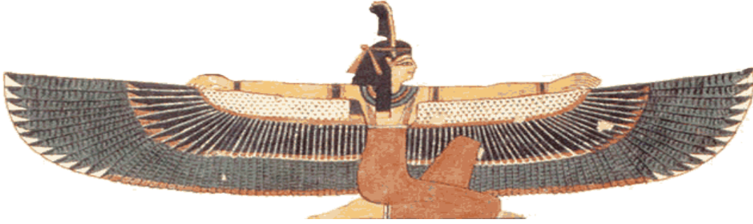
Resim 4, Ma'at

Mısır mitolojisinde ise adaleti sağlayan, yasalar yapan, suçluları cezalandıran, adalet ve doğruluk tanrıçası Maat'tır (Ma'at). Maat sözcüğü, hakikat, adalet, doğruluk, düzen, denge ve kozmik yasa gibi anlamlara gelmektedir. Ma'at, Thoth'un karısı ve Güneş Tanrısı Ra'nın kızıdır. O da bir tanrıçadır ve adalet dağıtmak için Hakikat Evinde oturmaktadır. Osiris'in mahkemesinde insanların kalplerini doğruluk tüyüyle tartar ve tanrısal adaleti sağlar.