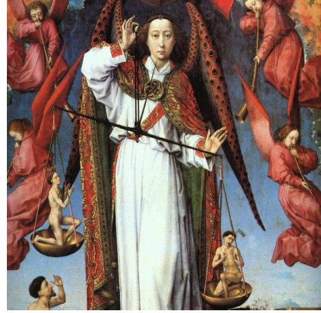
Resim 6, R. V. Weyden, "Alterpiece of the Last Judgement" 1443-46

Hıristiyan sanatında adalet kavramının içeriği kozmik düzen ve armoniden "tanrısal adalet" ve "tanrısal yargılama"ya dönüşmüştür. Adalet, çoğu kez eril görünümündedir. Fakat bu erillik İsa'dan da bildiğimiz gibi cinsiyetler üstü bir erilliktir. Adalet artık Tanrı iradesine bağlıdır ve etkin bir konumdadır. Kılıç, "güç, otorite ve adalet" simgesi olarak görülmüştür. Baş melek Mikail ve Elçi Pavlus'un başlıca niteliklerinden biri kılıç sahibi olmalarıdır. Bu kılıç, hemen ardından Katolik kilisesinin hem seküler hem manevi erk savaşında da "çifte kılıç kuramı" olarak tarihsel birçok olaya neden olacaktır.