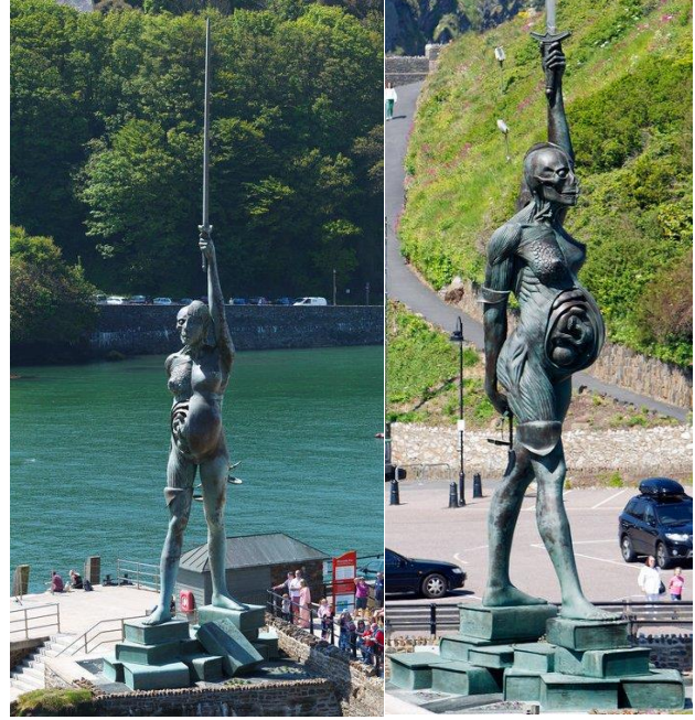
Resim 9, Damien Hirst "Verity"

terazi hem oran olarak çok küçük hem de dengesi şaşmış bir şekilde yamuk duruyor. Sol eli ise kılıçla birlikte yukarıya kaldırılmış -sanki "özgürlük" heykelini anımsatıyor. Kılıcın boyutu neredeyse beden boyutuna eş, çok büyük bir kılıçla ayaklarının altında, üst üste yığılmış birçok hukuk kitabı üzerinde yükseliyor figür.