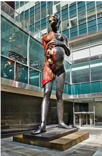
Resim 10, Hirst Damian, “Virgin Mather” New York

Degas, “on dört yaşındaki dansçı” heykeli için Paris operasında dansçılık yapan Marie Van Goethem’i model almış ve modelinin yüz hatlarını, alnını ve burnunu düzleştirip, çenesini öne çıkararak özenle, o dönemde kriminal antropologların “suçlu” tiplemesine dönüştürmüştü ki bu tipleme aynı zamanda ‘ikinci sınıf’ insanları tanımlamada da kullanılıyordu. “Çünkü Bale, on dokuzuncu yüzyılda önceki yüzyıllardaki ya da bugünkü gibi saygın, değerli bulunan bir dans olarak değil de; daha çok erkeklerin gözüne hitap eden bir eğlence türü olarak algılanıyordu. Dansçılar çoğunlukla alt sınıftan geliyorlardı ve sadece dans ederek yeterli para kazanamadıklarından dolayı da (aynen Marie van Goethem gibi) zaman zaman fahişelik yapmaya yöneliyorlardı.” (Salgırlı,2012) .Degas, heykelini balmumundan yapmıştı ve 1881’deki Altıncı Empresyonist Sergi’de cam bir vitrine yerleştirip sergilediğinde tepkiler; ‘hayvansı cüreti olan bir kız maymununu, bir canavarı’ temsil ettiği ve bir dansçıyı değil de bir fahişeyi sergilediği düşünölmüştü.