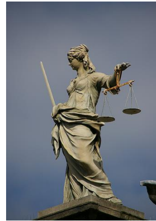
Resim 3, Madonna justitia a dublin, İrlanda