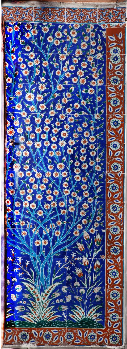
1: III. Murad Has Odası girişinde yer alan bahar ağaçlı pano. 16. Yüzyıl, İznik.