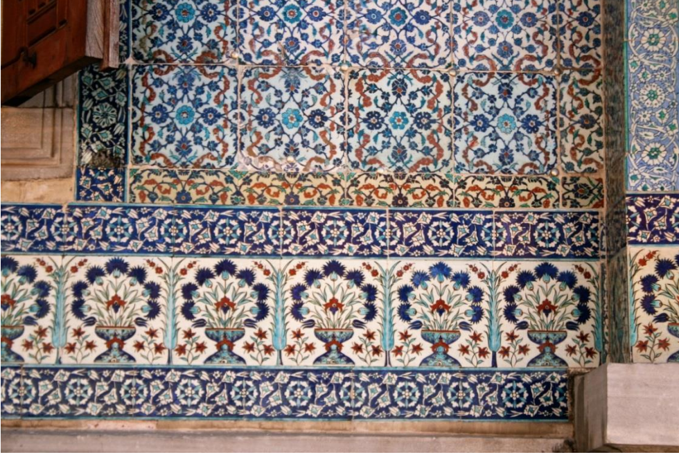
2: Çifte Kasırlar dış cephesinde Kütahya çinileri, Cumhuriyet Dönemi.