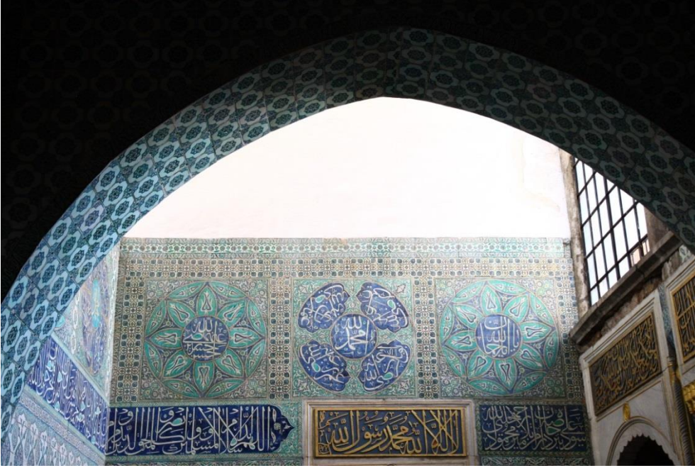
3: Şadırvanlı Sofa'da 17. yüzyıl çini kitâbeler. Fotoğraf: 2014, Zehra Dumlupınar.